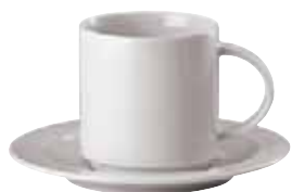
Cup / Obertasse / Tazza 0,22 ltr. / 7 3/4 oz. 67303-45