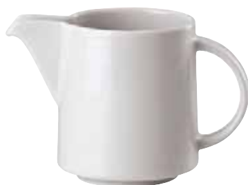
Creamer / Gießer / Lattiera 0,30 ltr. / 10 1/2 oz. 67303-59