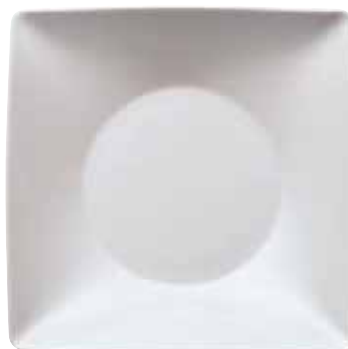
Plate deep square / Teller tief quadratisch / Piatto fondo quadrato