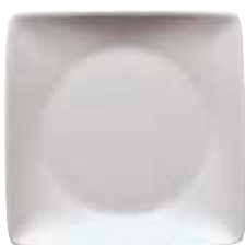
Dish flat square / Schälchen flach quadratisch / Piattino piano quadrato