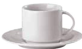
Cup / Obertasse / Tazza 0,18 ltr. / 6 1/3 oz. 67303-41