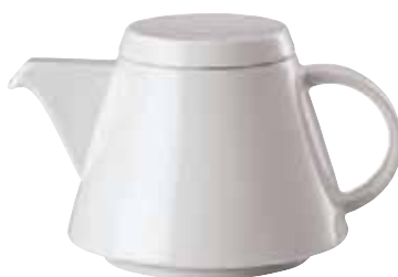
Base tea pot / Teekannen-Unterteil / Teiera senza coperchio 0,40 ltr. / 14 oz. 67303-53