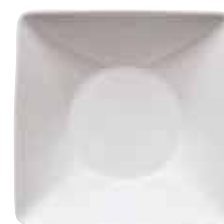
Bowl deep square / Schälchen tief quadratisch / Piattino fondo quadrato