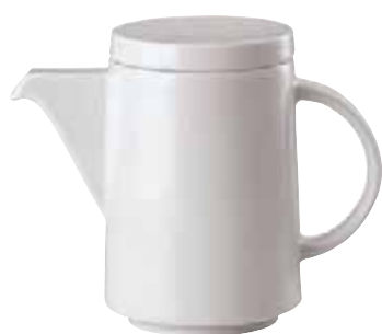
Base coffee pot / Kaffeekannen-Unterteil / Caffettiera senza coperchio 0,30 ltr. / 10 1/2 oz. 67303-49