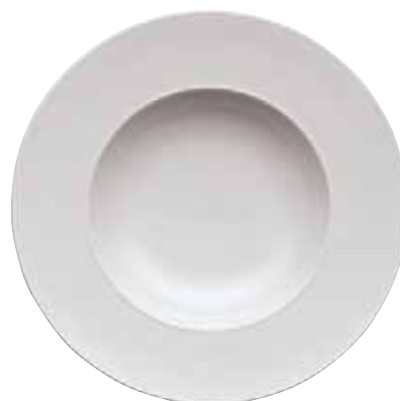
Plate flat / Teller flach / Piatto piano