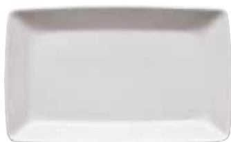
Plate flat rectangular / Platte flach rechteckig / Piatto piano rettangolare