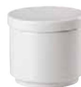
Base sugar bowl / Zuckerdosens-Unterteil / Zuccheriera senza coperchio 0,15 ltr. / 5 1/4 oz. 67303-62